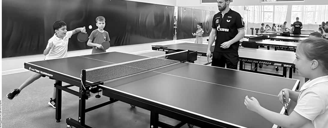
Юные горожане с удовольствием постигают секреты игры в настольный теннис

✂ Записаться на секцию можно по номеру телефона: 8(932)858-94-59.