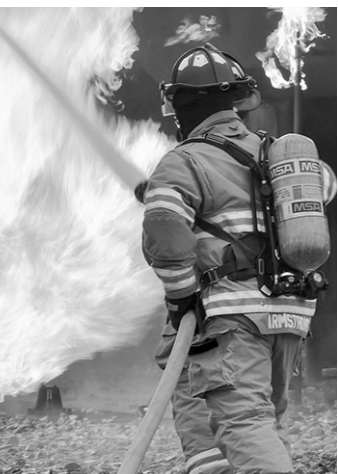
К тушению пожаров привлекаются огромные силы

Актуально С 1 июля на территории республики введен особый противопожарный режим. Особый противопожарный режим — это дополнительные требования пожарной безопасности, устанавливаемые органами государственной власти или органами местного самоуправления в случае повышения пожарной опасности на соответствующих территориях. В период введения особого противопожарного режима категорически запрещено: разводить костры на территориях поселений и городских округов, садоводческих, огороднических и дачных некоммерческих объединений граждан; сжигать мусор, стерно, пожнивные и порубочные остатки, сухую растительность, листву; проводить неконтролируемые отжиги сухой растительности, а также по-