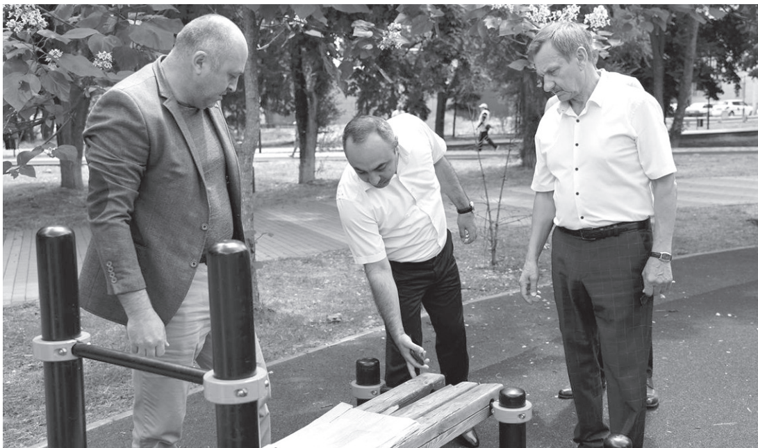
Рабочая группа проверяет исправность спортивного оборудования