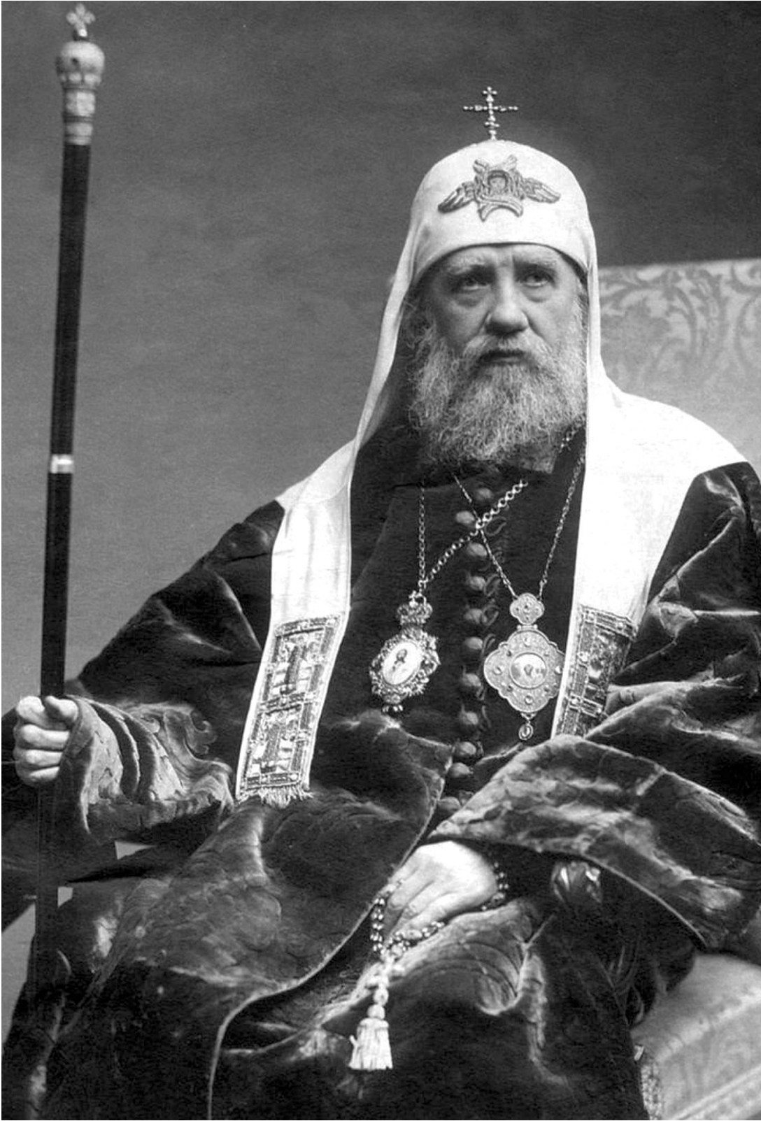
Святитель Тихон был добрым человеком, непритязательным в быту, любил книги

9 октября 1989 года святитель Тихон был прославлен Архиерейским Собором Русской Православной Церкви. В ноябре 1991 года в Малом соборе Донского монастыря произошел пожар, при восстановительных работах были обнаружены мощи святителя Тихона, похороненного здесь в 1925 году. 22 февраля 1992 года совершилось обретение святых мощей патриарха Тихона. Они покоятся в Большом соборе Донского монастыря Москвы и, напомним, скоро придут в нашу республику. оляга михайлова